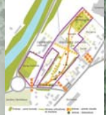
La végétation, un lien important