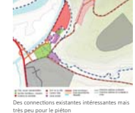
Des connections existantes intéressantes mais très peu pour le piéton