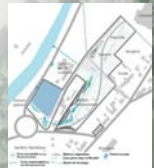
Transformer les contours du site en parc.