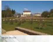
Verger en ville