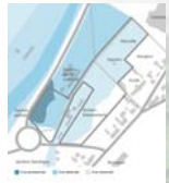
Une zone inondable