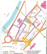
Recentrer le parc au cœur de la ville.