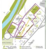
Un potentiel végétal important qui connecte le parc à la ville