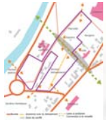
Des connections à la ville intéressantes

friche urbaine dont la végétation à largement pris le dessus mais qui, est peu attrayant et par conséquent peu fréquentable. La commune a donc décidé de faire de cette zone un parc, le parc du Bas Chêne, afin d'offrir aux habitants un véritable poumon vert, cœur de la ville.