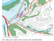
Un site pris dans les crues de la Moselle