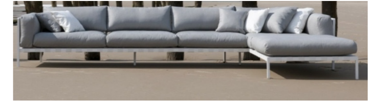
Salon de jardin, simple, sobre de par sa forme et sa couleur.