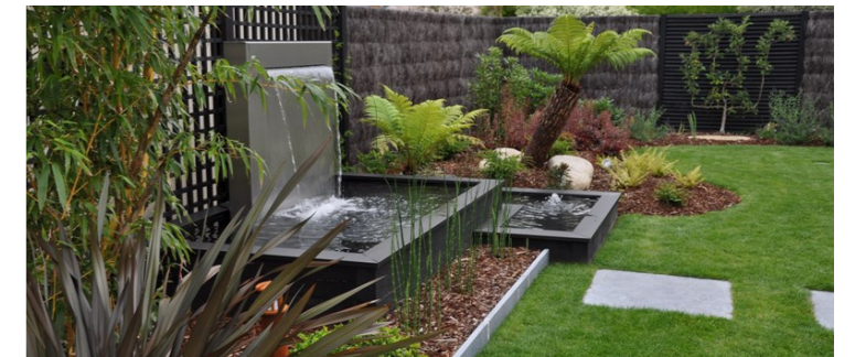
Bassin se déversant dans le niveau inférieur par le biais d'une lame d'eau. Très tendance de nos jours