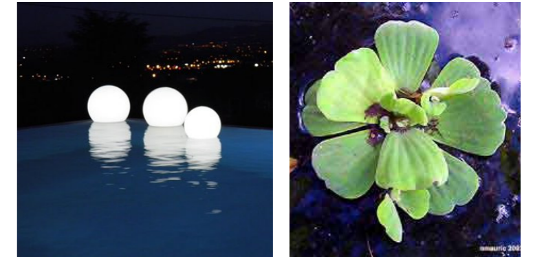
Boules lumineuses pour répondre à la demande de lumières et donner un aspect cozi et Laitue d'eau compléter le bassin