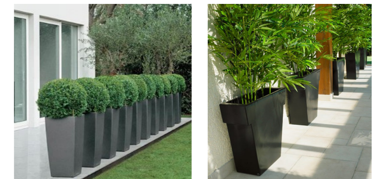
Buis et Bambous en pot pour aménager l'extérieur