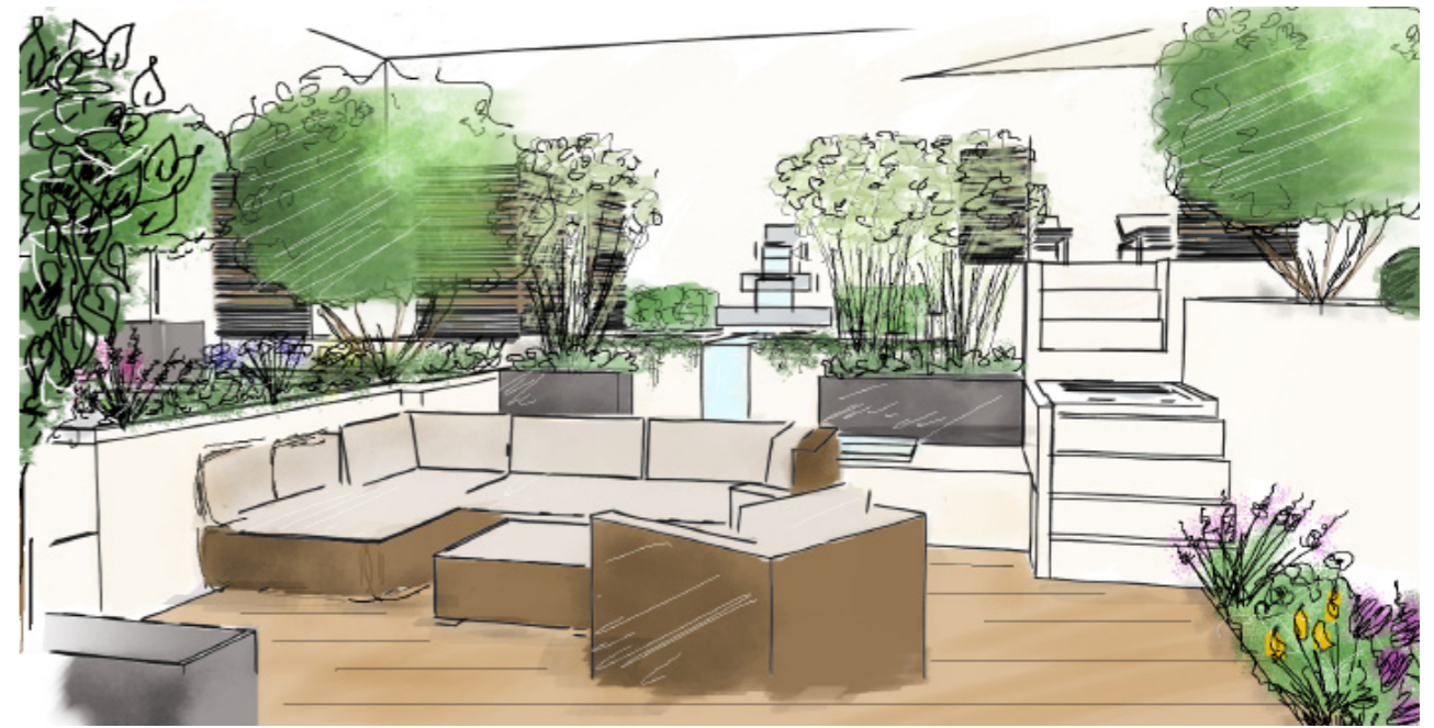
Une vue plongeante depuis la porte d'entrée