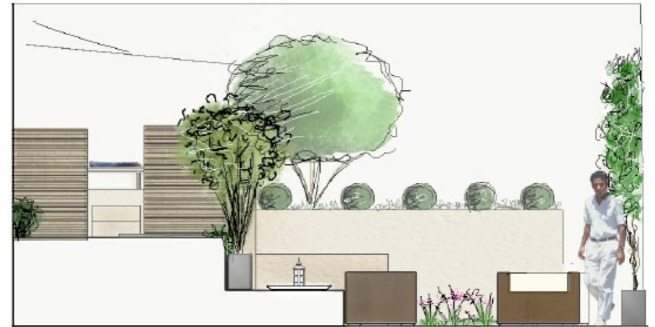
Coupe en direction de l'est

1 Un lieu pour s'y reposer après un repas à l'intérieur, ou profiter de l'extérieur pendant une journée ensoleillée.