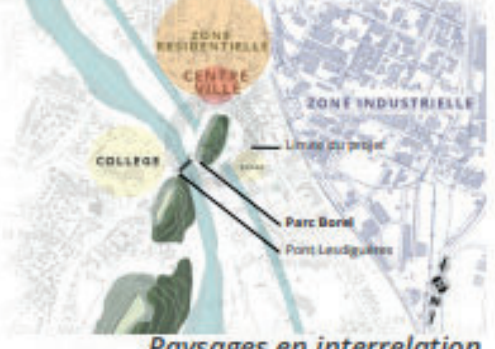
Paysages en interrelation