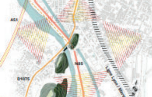
Axes de circulations