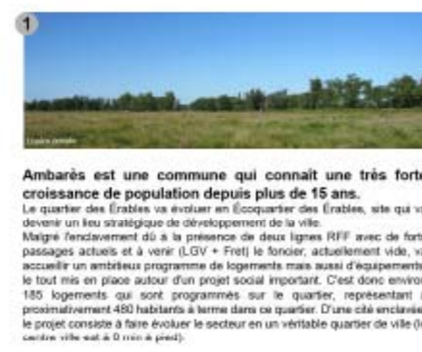
Ambarès est une commune qui connaît une très forte croissance de population depuis plus de 15 ans.