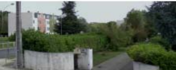
Une mixité sociale à favoriser