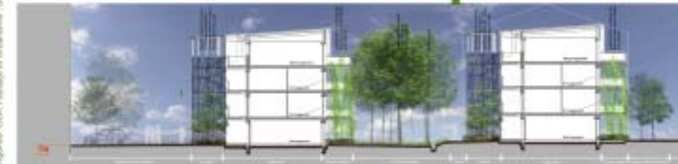
La vie du quartier dans un écran de verdure