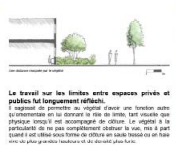
Un travail sur les limites séparatives entre espaces publics/privés