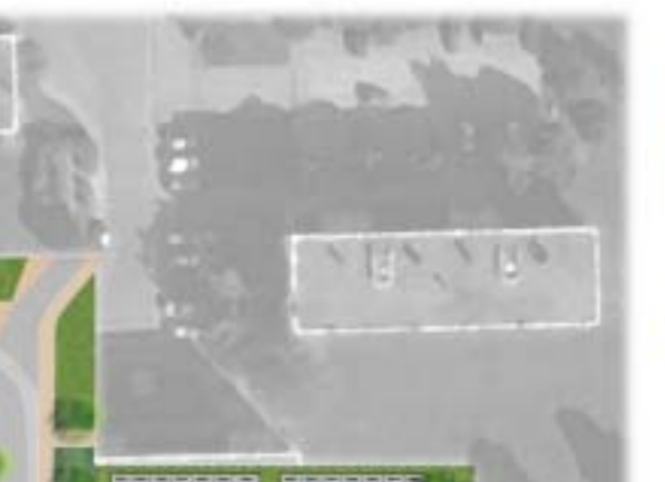
Le travail sur les limites entre espaces privés et publics fut longuement réfléchi.