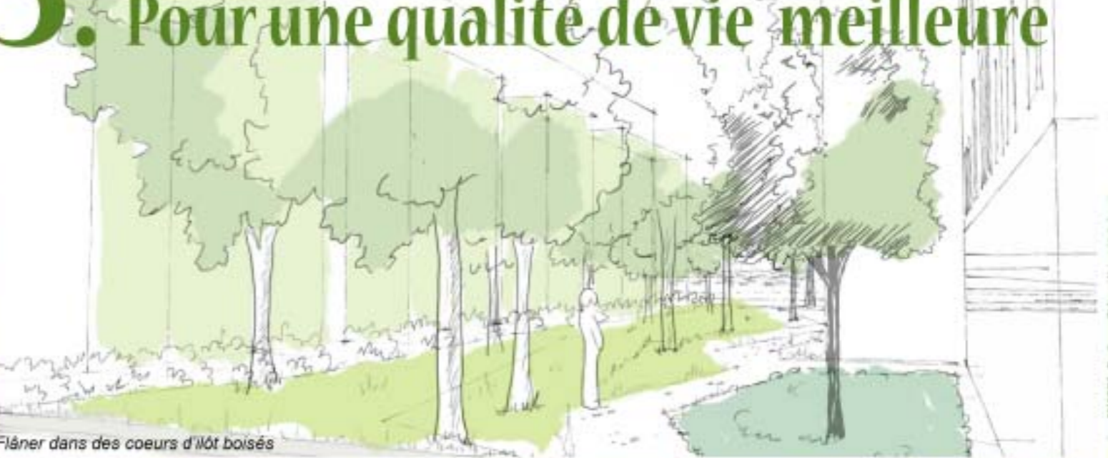
Flâner dans des coeurs d'îlot boisés