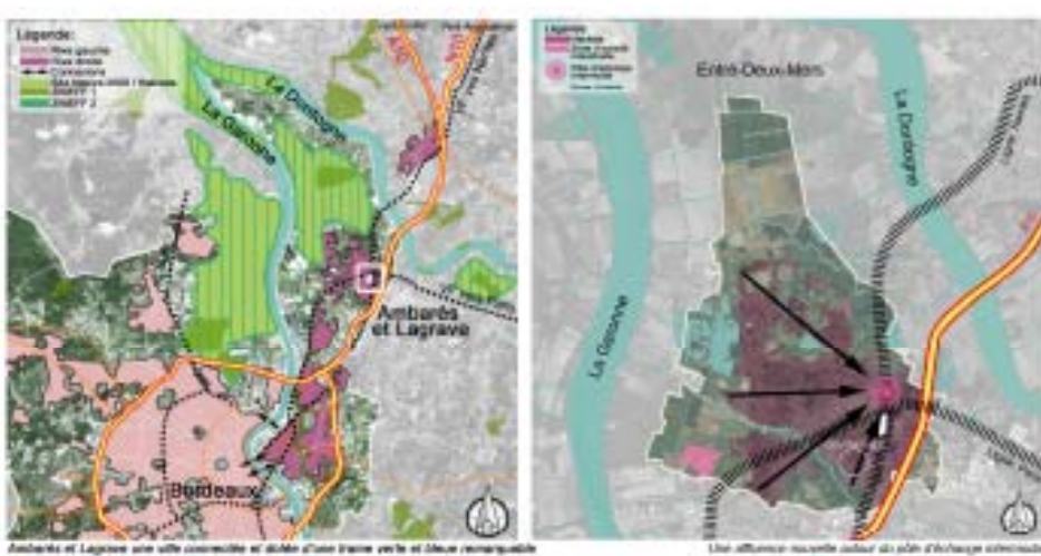
Ambarès et Lagrave une ville connectée au réseau d'axes France verte et bleue remarquable