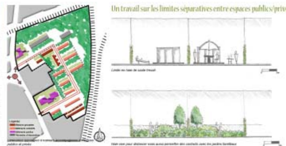
Un travail sur les limites séparatives entre espaces publics/privés