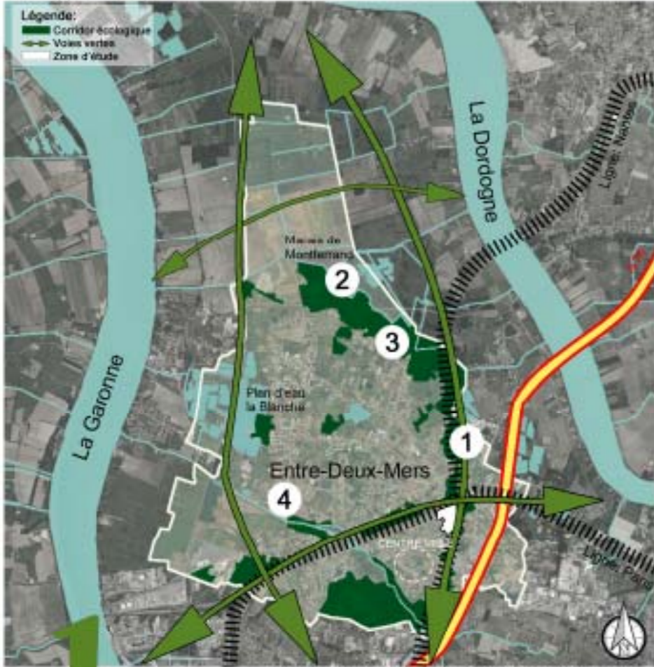
Entre-deux-mers, un territoire riche à valoriser par des corridors écologiques