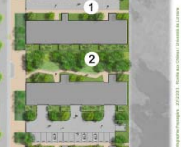
Il s'agissait de permettre au végétal d'avoir une fonction autre qu'ornementale en lui donnant le rôle de limite, tant visuelle que physique lorsqu'il est accompagné de clôture. Le végétal a la particularité de ne pas complètement obstruer la vue, mis à part quand il est utilisé sous forme de clôture en saule tressé ou en haie vive de plus grandes hauteurs et de densité plus forte.