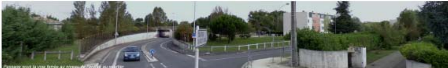
Passage sous la voie ferrée au niveau de l'entrée du quartier