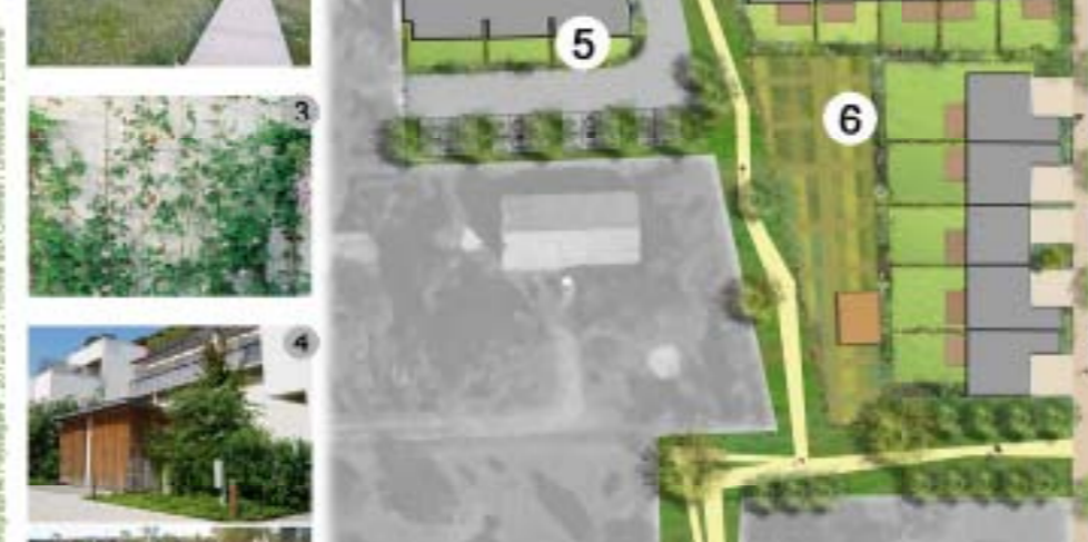
Il s'agissait de permettre au végétal d'avoir une fonction autre qu'ornementale en lui donnant le rôle de limite, tant visuelle que physique lorsqu'il est accompagné de clôture. Le végétal a la particularité de ne pas complètement obstruer la vue, mis à part quand il est utilisé sous forme de clôture en saule tressé ou en haie vive de plus grandes hauteurs et de densité plus forte.