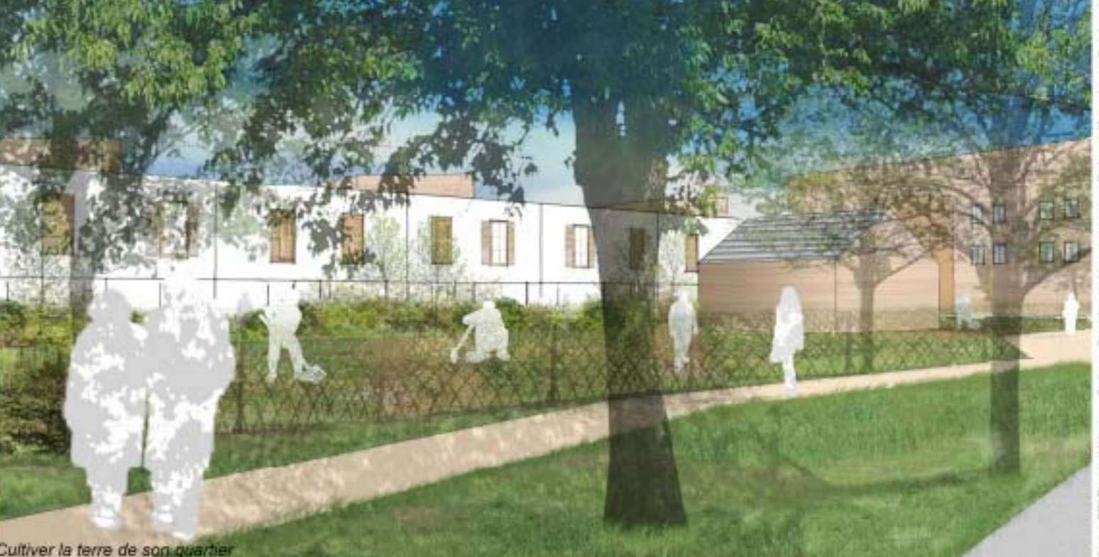
Cultiver la terre de son quartier