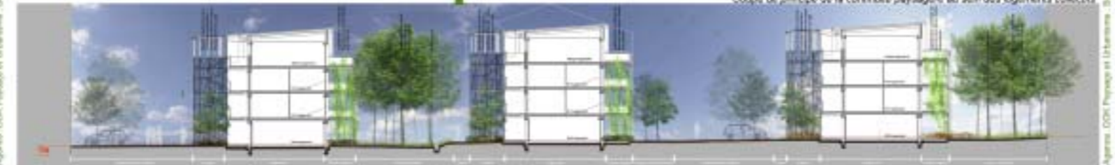
Coupe de principe de la continuité paysagère au sein des logements collectifs

Agence : G&P Pénicaud et Urbanisme - Bordeaux - Conception graphique et mise en page : D'Architecture M&M - Lézignan - 2012/2013 - Rendu par Olivier Urbanisme et Lézignan