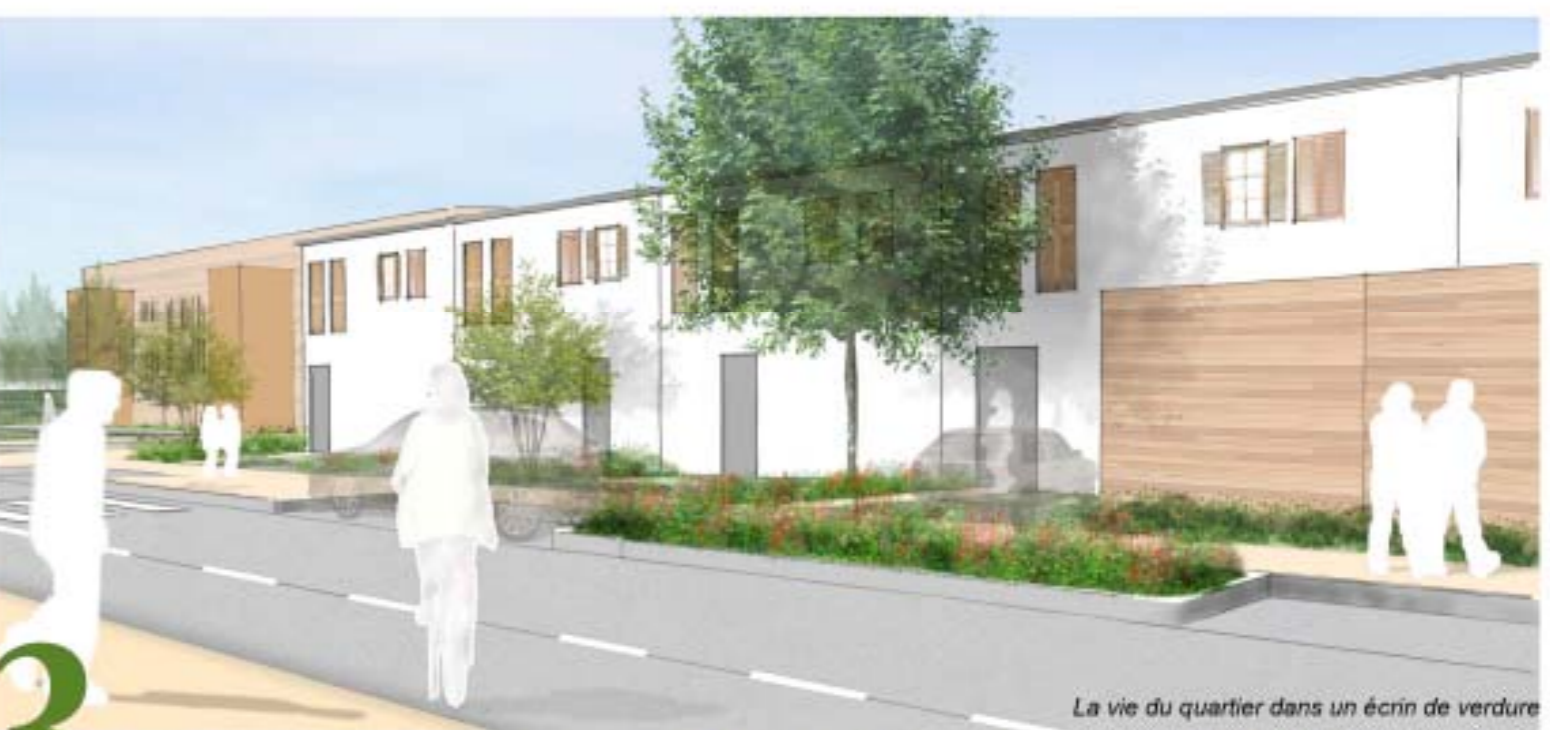
La vie du quartier dans un écran de verdure