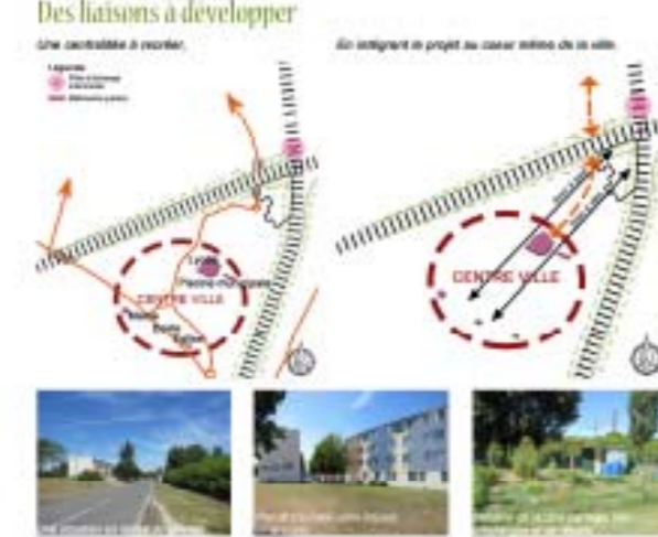
Malgré l'endossement dû à la présence de deux lignes RFF avec de forts passages actuels et à venir (LGV + Freil) le foncier, actuellement vide, va accueillir un ambitieux programme de logements mais aussi d'équipements, le tout mis en place autour d'un projet social important. C'est donc environ 185 logements qui sont programmés sur le quartier, représentant à proximité 480 habitants à terme dans ce quartier. D'une cité éclaircie, le projet consiste à faire évoluer le secteur en un véritable quartier de ville (le centre ville sans le D train à pied).