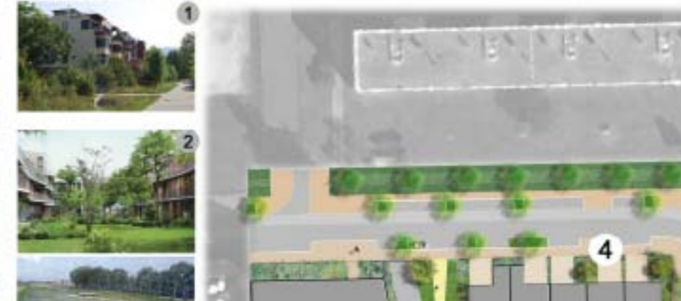
Le travail sur les limites entre espaces privés et publics fut longuement réfléchi.