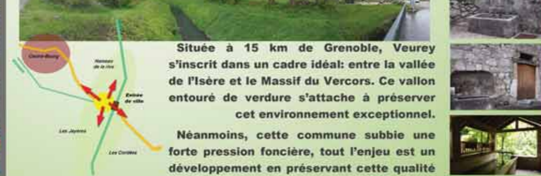
Située à 15 km de Grenoble, Veurey s'inscrit dans un cadre idéal: entre la vallée de l'Isère et le Massif du Vercors. Ce vallon entouré de verdure s'attache à préserver cet environnement exceptionnel.