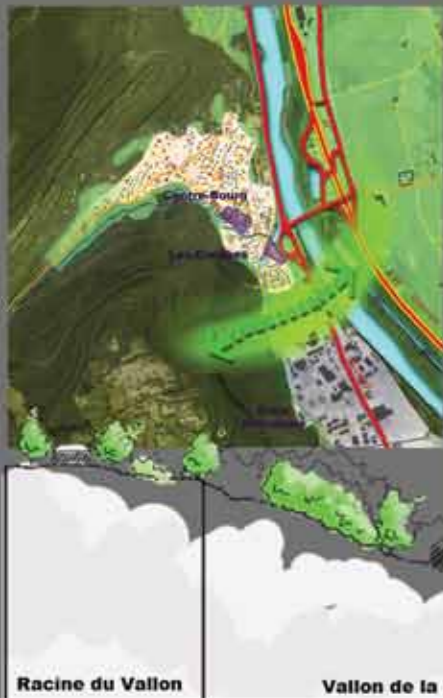
Un environnement exceptionnel inscrit au rang des PNR