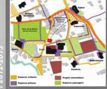
Un centre morcelé