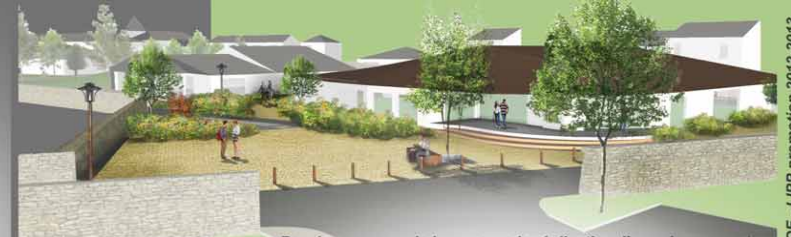
Recréer un coeur de bourg avec la réalisation d'une place ouverte en lien directe avec la salle des fêtes et la Mairie pouvant accueillir cérémonies et autres célébrations