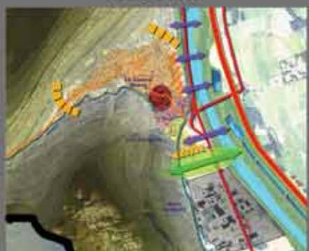
Les enjeux prioritaires en vue du PADD