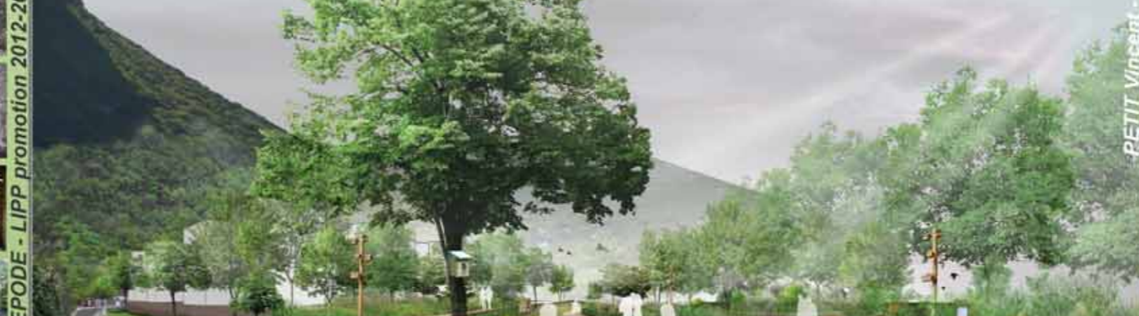
Une ambiance naturelle aux portes de l'urbain