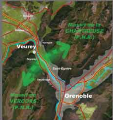
Veurey: la porte d'entrée de Grenoble au pied du Massif du VERCORS