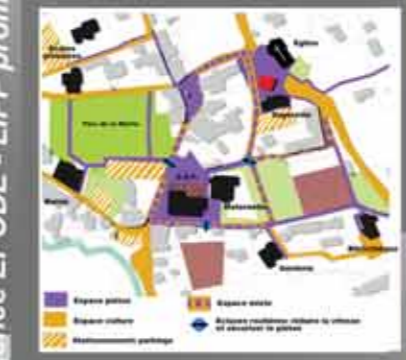
Retrouver une centralité avec la création d'un nouveau parvis piéton