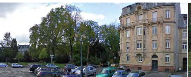
Rue Alfred Engel avant travaux