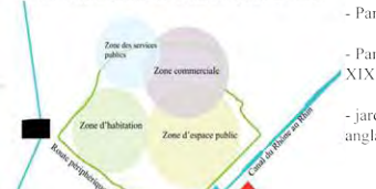
Des zones ciblées dans le centre-ville