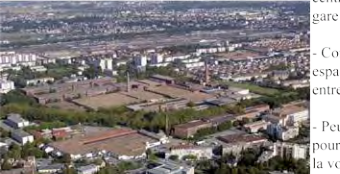
Une ville grise due à son passé industriel