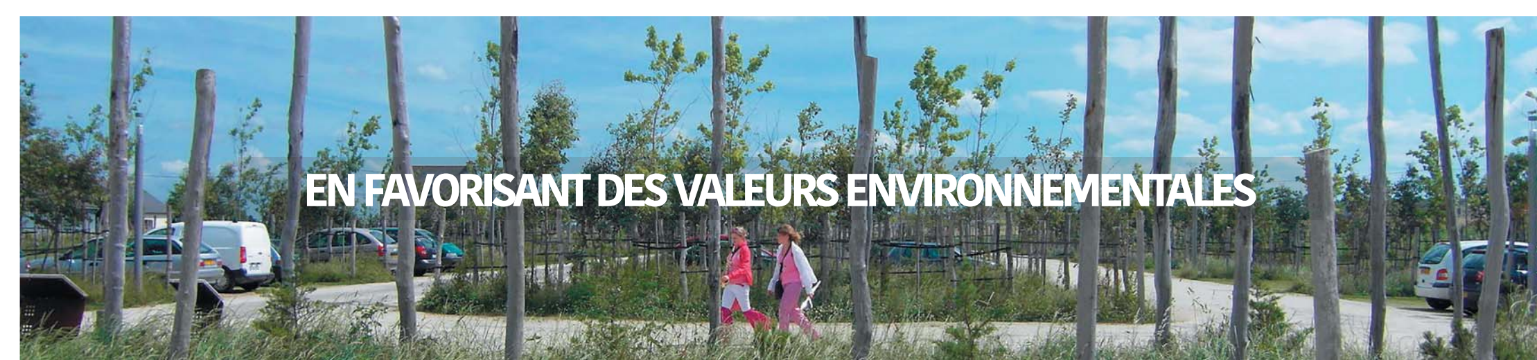
Perspective du Grand Pré