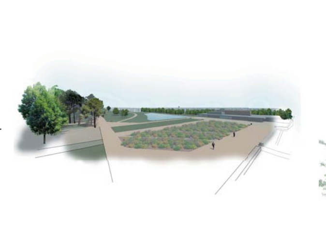
Perspective du jardin d'ombre