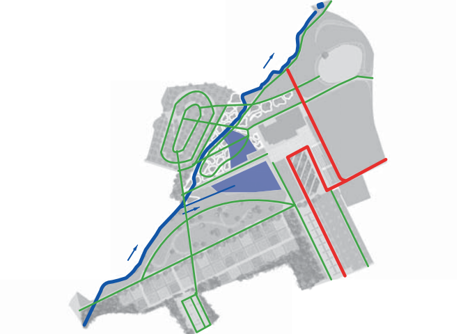
Schéma de fonctionnement piétonnier et hydrographique

LE GRAND PRÉ : CONCEVOIR UN TRAIT D'UNION ENTRE LE CENTRE VILLE ET LA BAIE