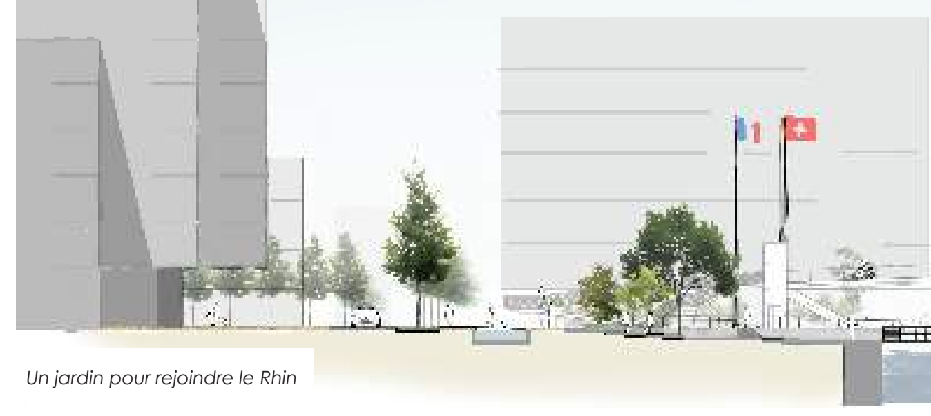
Un jardin pour rejoindre le Rhin