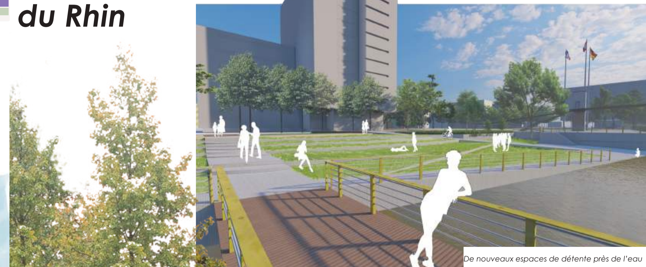
De nouveaux espaces de détente près de l'eau