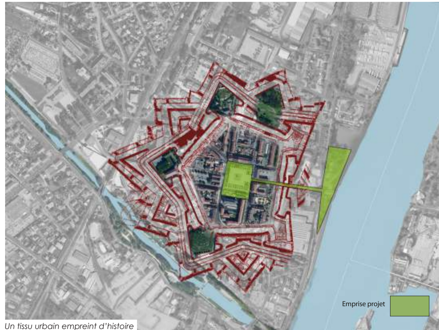
Un tissu urbain empreint d'histoire