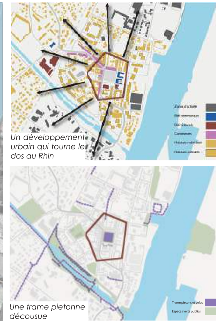
Un développement urbain qui tourne le dos au Rhin