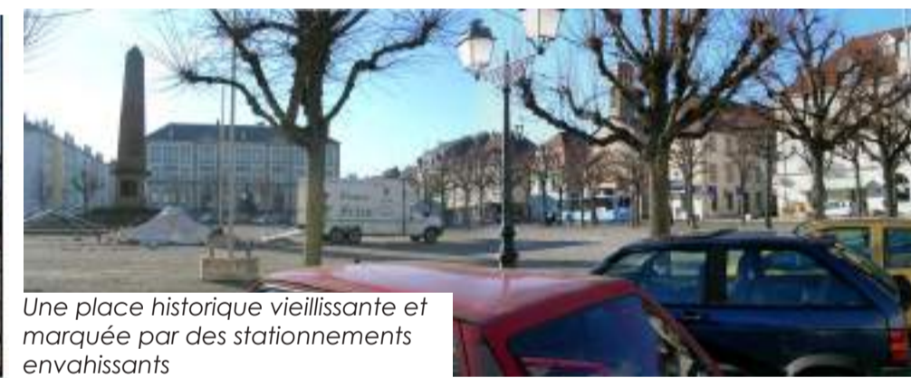
Une place historique vieillissante et marquée par des stationnements envahissants