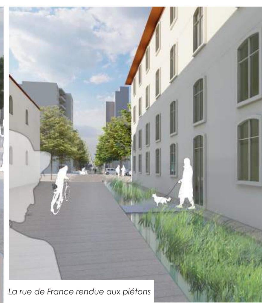
La rue de France rendue aux piétons