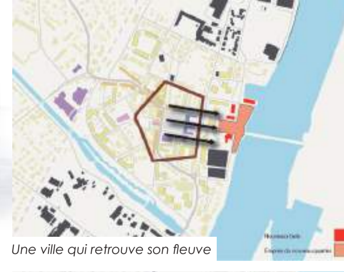
Une ville qui retrouve son fleuve