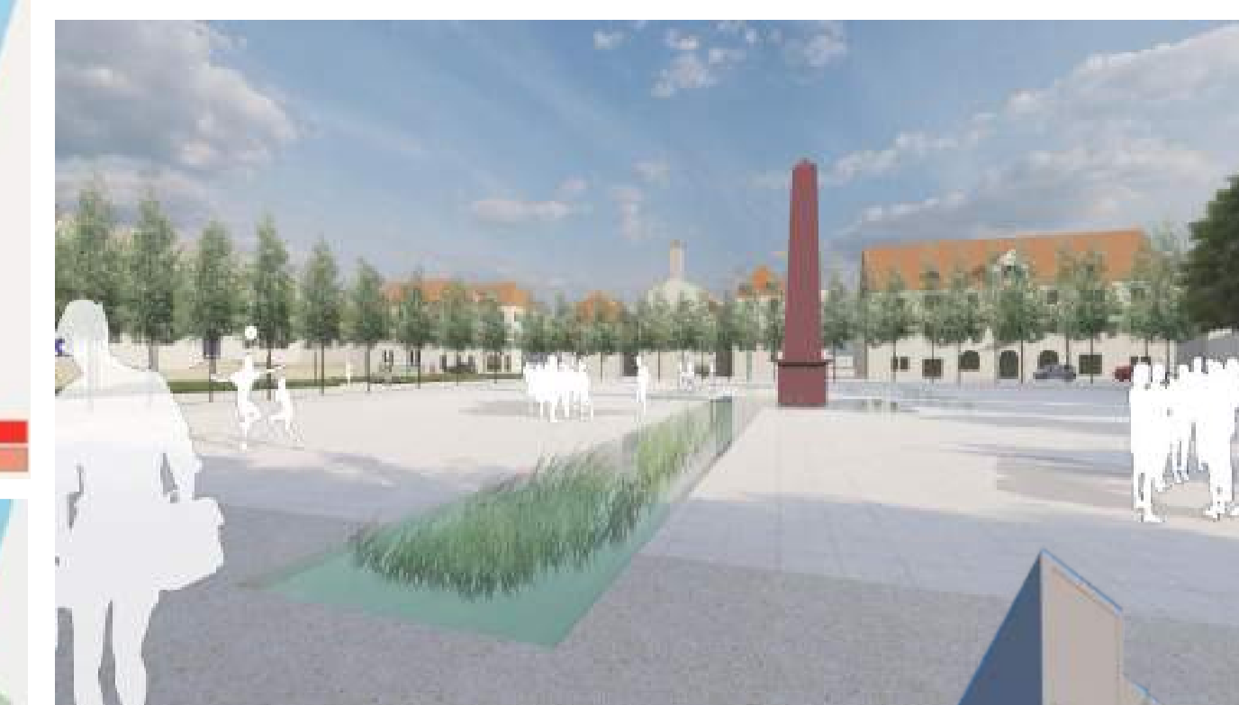
La place Abbatucci modernisée