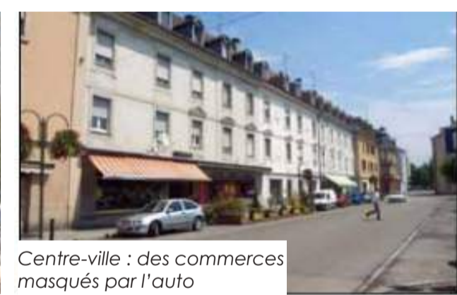
Centre-ville : des commerces masqués par l'auto