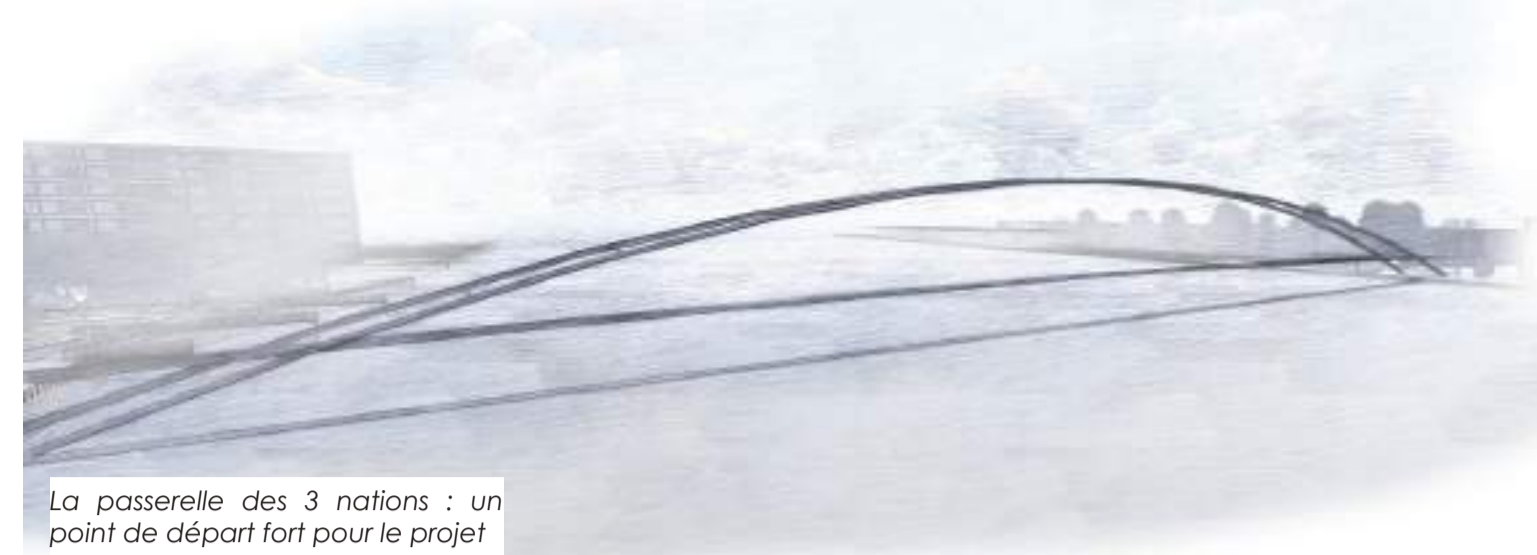
La passerelle des 3 nations : un point de départ fort pour le projet