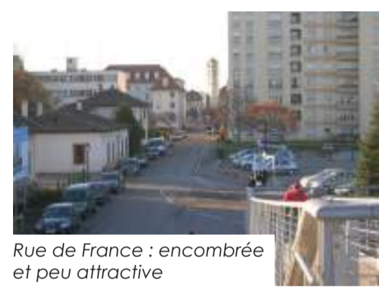
Rue de France : encombrée et peu attractive