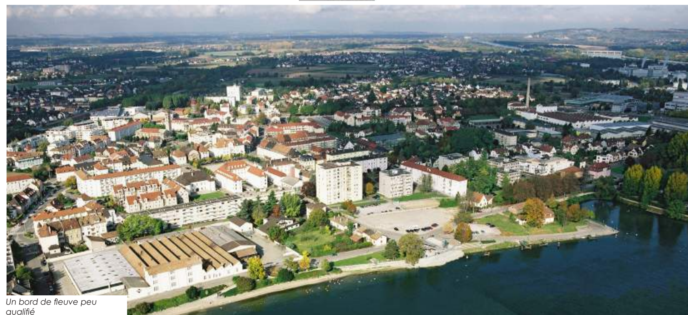
Un bord de fleuve peu qualifié