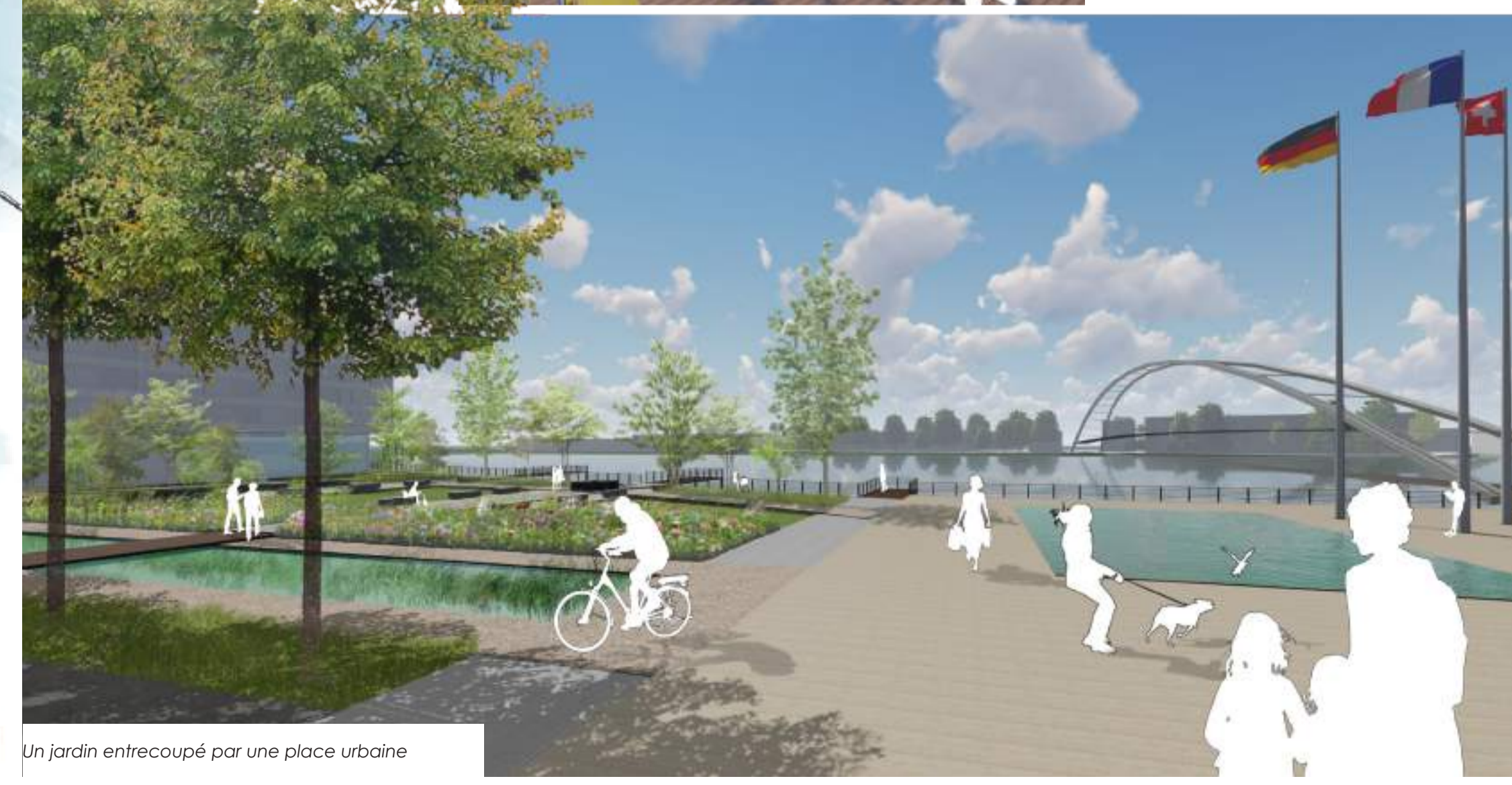
Un jardin entrecoupé par une place urbaine