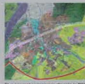
Et qui seront conservées d'après le PCO. On peut développer en DDE Verte.