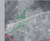
Une trame verte morcelée suivant la trame bleue.