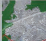
Des trames écologiques fractionnées par le parc thermal et des espaces agricoles.