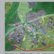
Devenir «Cité-jardin» en conservant ses zones végétalisées tout autour.