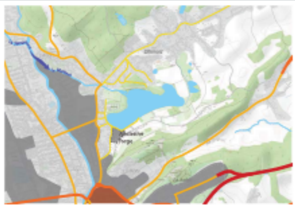
Un lieu «historique»