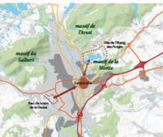
Une ville entourée d'espaces naturels mais dans laquelle les parcs de loisirs sont rares