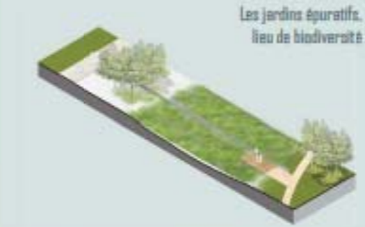
Les jardins épuratifs, lieu de biodiversité