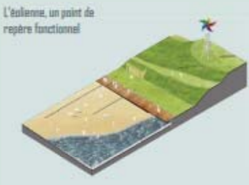
L'Éoliène, un point de repère fonctionnel