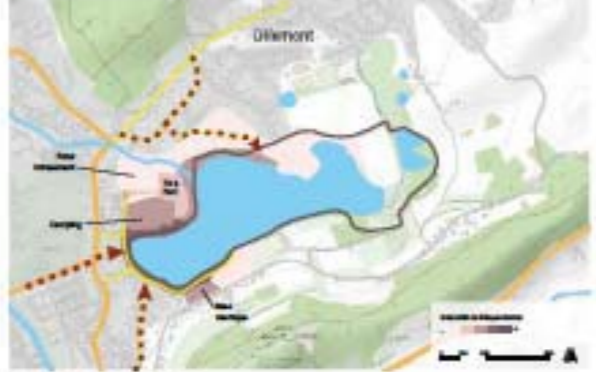
Des espaces délaissés