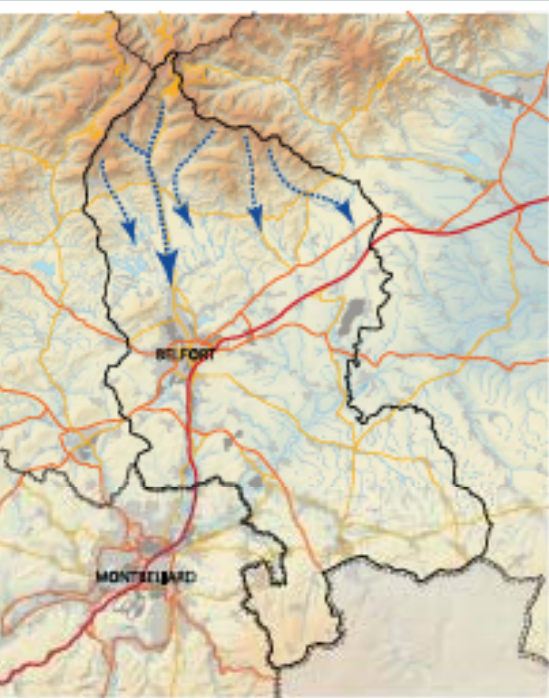
Un fort réseau hydraulique dû au massif des Vosges