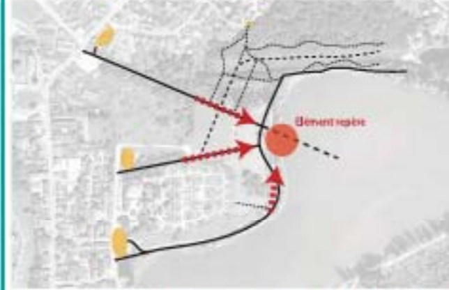
Diversifier les parcours pour une perception dynamique du site