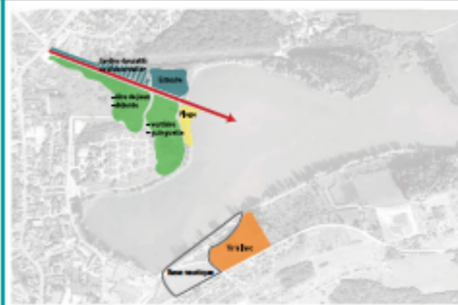
Créer des espaces structurés et hiérarchisés pour des usages multiples

DES ESPACES HIÉRARCHISÉS POUR UNE DÉCOUVERTE PLUS RICHE DU SITE