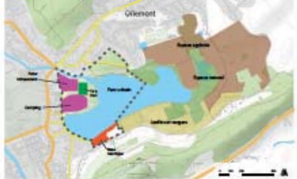
Un site «découpé»