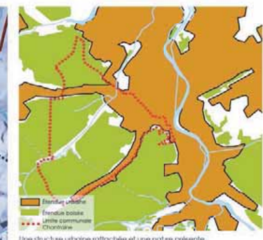
Une structure urbaine rattachée et une nature présente